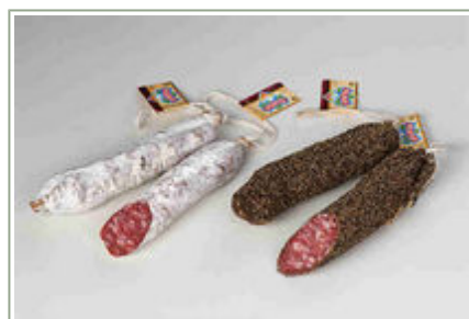
Salchichón casero extra (izq.) y a la pimienta (derecha).