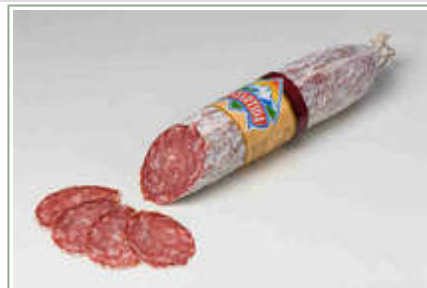
Imagen de Salchichón Extra Artesano.