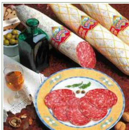
Bodegón con piezas de Salchichón Extra Cular.