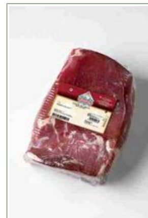
Centro jamón moldeado pulido.

Peso unidad: 3,5 Kg. Unidades por caja: 1 Unidad Caducidad: 184 Días. EAN 13: 8424924005682