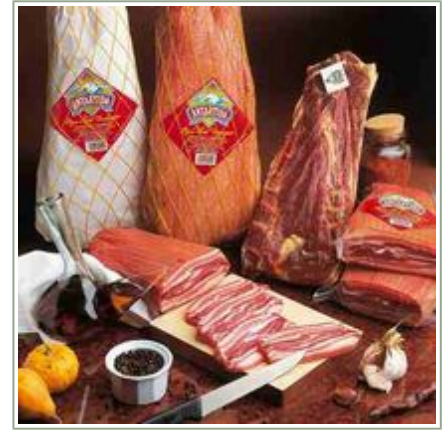
Bodegón con piezas de Panceta.

Peso unidad: 1,35 Kg. Unidades por caja: 4 Unidades Caducidad: 184 Días. EAN 13: 8424924005408