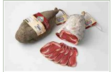
Bayona Pimienta(izquierda), de Jamón(derecha).

Peso unidad: 0,7 Kg. Unidades por caja: 7 Unidades Caducidad: 184 Días. EAN 13: 8424924005620