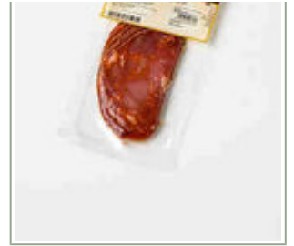
Loncheado 100 gr. chorizo pimienta.

Peso unidad: 0,100 Kg. Unidades por caja: 20 Unidades Caducidad: 155 Días. EAN 13: 8424924007761