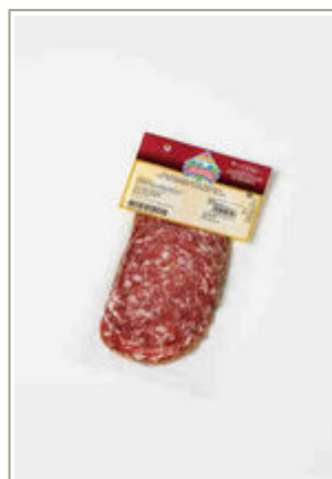
Loncheado Salchichón Pimienta.

Peso unidad: 0,100 Kg. Unidades por caja: 20 Unidades Caducidad: 155 Días. EAN 13: 8424924007297