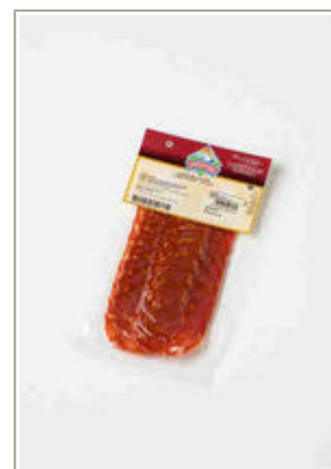
Loncheado 100 gr. chorizo extra.

Peso unidad: 0,100 Kg. Unidades por caja: 20 Unidades Caducidad: 155 Días. EAN 13: 8424924007280